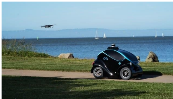
图 4 地空协同安保机器人

无人机和地面移动机器人配合，可以扩展机器人对环境感知的能力，提高机器人工作效率，见图 4。