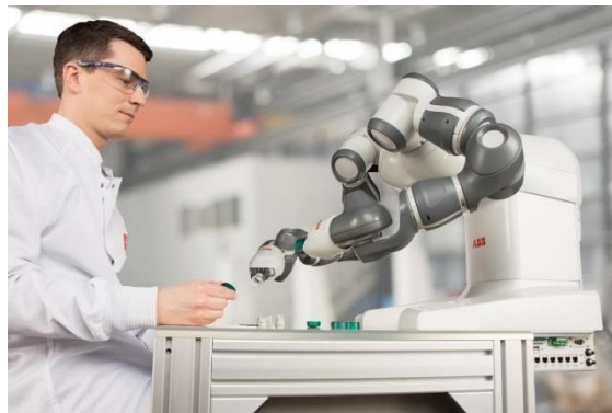
图 2 双臂协作机器人 YuMi

ABB 公司也有一款双臂协作型机器人，名叫 YuMi。作为一款人性化设计的双臂机器人，YuMi 使小件装配等自动化作业进入一个全新时代。工人和机器人可以和谐共处，共同完成同一个任务如图 2 所示。YuMi 在英文中是“你和我”协同工作的简称。这样的协作系统让机器人完成制造任务中那些繁琐的重复动作，而让专业人员专注于核心需求。