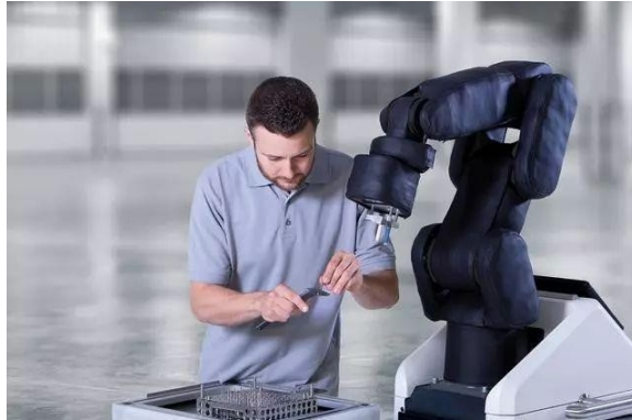
图 1 协作机器人 APAS

接触产生的非常规力，并给控制器提供一个即时反馈。同时，机器人还有安全距离保护，当检测到人靠得太近时，也会自动降低运行速度；在人离开该区域后，机器人会自动恢复正常速度，相当于隐形的防护网。